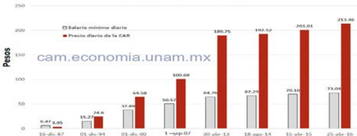
Evolución del precio de la Canasta Alimenticia Recomendable y el salario mínimo en México, 1987-2016.

Elaborado por el Centro de Análisis Multidisciplinario CAM-UNAM. Junio 2016.